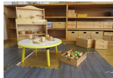
ままごと&積木のコーナー